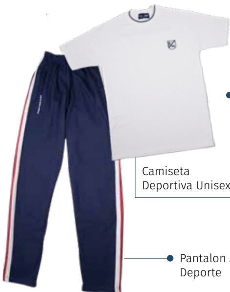
Camiseta Deportiva Unisex