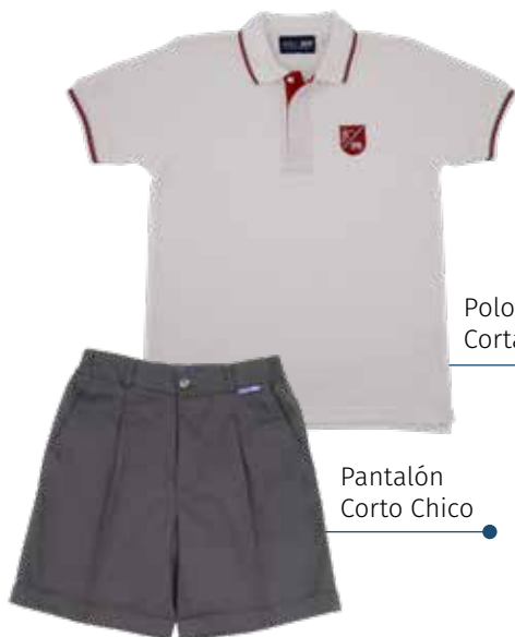
Polo manga Corta Unisex