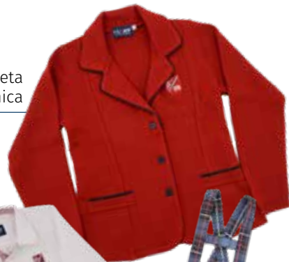
Chaqueta Granate Chica