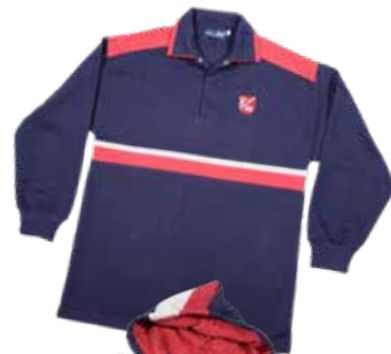
Sudadera Azul con Capucha