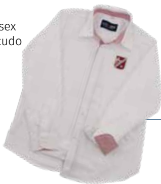
Camisa de manga larga blanca Chico con escudo