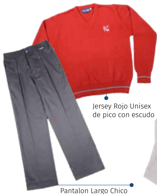
Jersey Rojo Unisex de pico con escudo