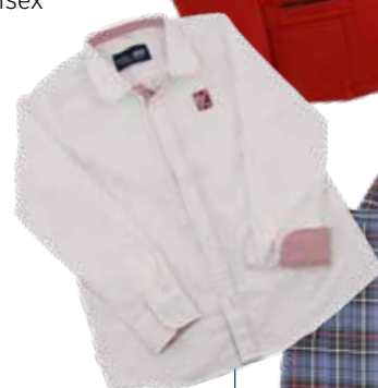
Camisa de manga larga blanca Chica con escudo