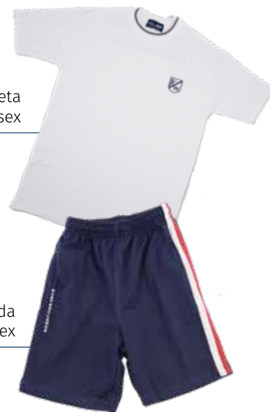
Camiseta Deportiva Unisex